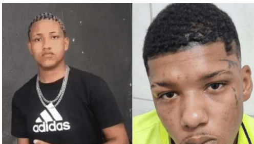
Jovens perderam as vidas em uma troca de tiros