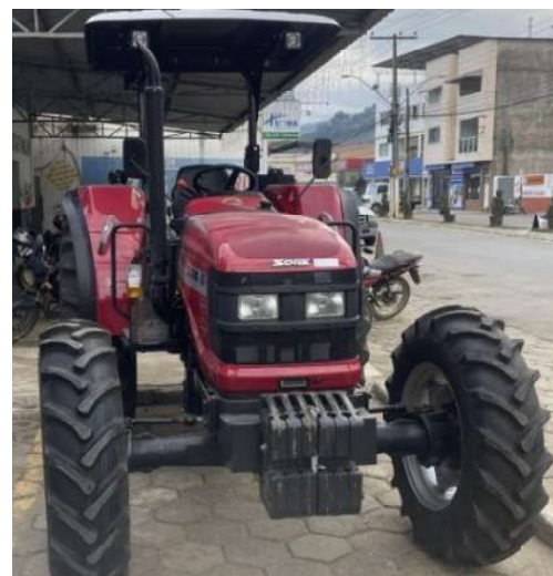
Água Branca recebeu um trator agrícola

Os seguintes municípios foram contemplados: Água Doce do Norte, Água Branca, Alegre, Alto Rio Novo, Anchieta, Apiacá, Aracruz, Baixo Guandu, Barra de São Francisco, Boa Esperança, Brejetuba, Cachoeiro de Itapemirim, Colatina, Conceição da Barra, Divino de São Lourenço, Governador Lindenberg, Guaçuí, Guarapari, Ibirapu, Ibitirama, Irupi, Itaguaçu, Itapemirim, Itarana, Iúna, Jaguaré, Jerônimo Monteiro, João Neiva, Mantenópolis, Marataízes, Marilândia, Mimoso do Sul, Muniz Freire, Muqui, Pedro Canário, Rio Bananal, São Gabriel da Palha, São Mateus, São Roque do Canaã, Vargem Alta, Vila Valério e Vila Pavão.