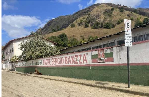
"O Rei de Quase Tudo" será apresentado na Escola Padre Sérgio Banzza

"Uma Viagem no Tempo" convida o público a embarcar em uma jornada histórica e afetiva, discutindo