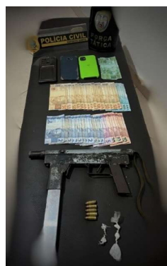
A ação aconteceu no Centro da cidade

O material apreendido e os conduzidos foram entregues na 17ª Delegacia Regional.