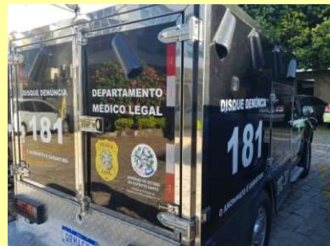
O último mês de junho foi o melhor entre todos os meses desde 1996, com a ocorrência de 41 assassinatos