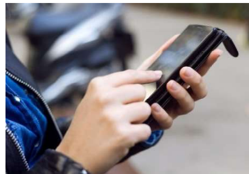
O cidadão que estiver de posse de celulares identificados como furtados ou roubados será intimado por meio de mensagens via WhatsApp, enviadas exclusivamente pelo número (27) 99849-4228

Com o Projeto Recupera, o compromisso do Estado é não apenas combater o crime, mas também trazer alívio e sensação de segurança para a população. Já que a Sesp e Polícia Civil entendem que a perda de um celular vai além do prejuízo material. Envolve também a perda de informações pessoais e, muitas vezes, afeta a vida profissional e social do cidadão.