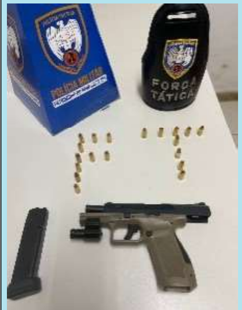
O foragido, considerado um dos líderes do tráfico na região de Cariacica e homicida procurado desde 2020, foi localizado após um monitoramento intensivo entre as forças policiais

A operação destaca a importância da integração entre as forças policiais, que, ao combinar inteligência e capacidade de resposta rápida, resultou na prisão deste indivíduo de alta periculosidade. Representando um grande avanço no combate ao crime organizado, removendo das ruas um criminoso de alta periculosidade e reforçando a segurança da comunidade local.