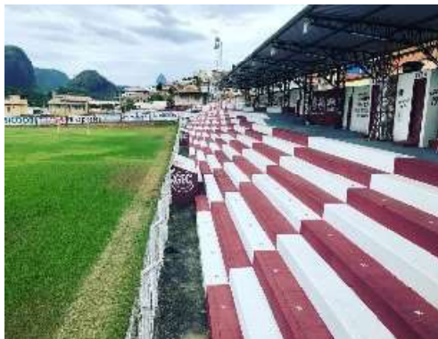
Guarany e Nova Brasília se enfrentam no estádio Adelino R. Alves neste domingo (28)

A organização é da Associação Gabrielense de Árbitros de Esporte Amador (Denilson Arbitragens).