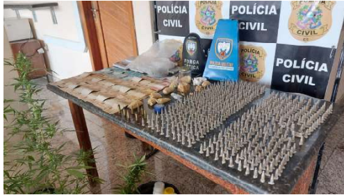
Um dos indivíduos localizado em uma residência alvo estava com mandado de prisão na comarca de João Neiva

Na operação foram detidos os três indivíduos contra os quais haviam os mandados de prisão,